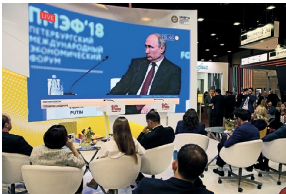
Во время пленарного заседания ПМЭФ прильнул к экранам