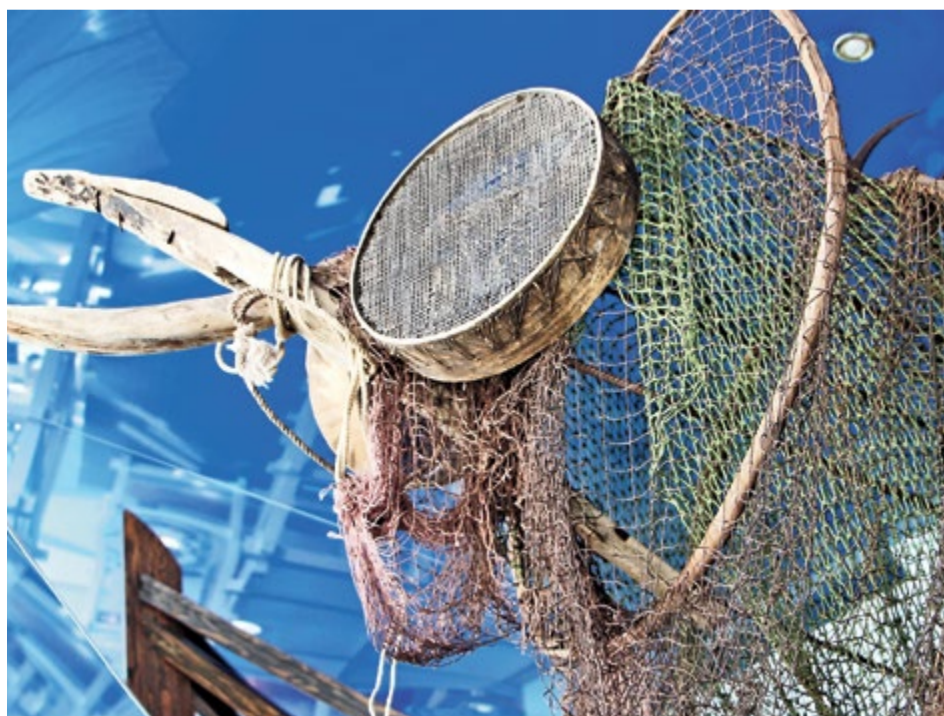
У Рыбы Арктиды пасть из деревянных щипцов, которыми бросали горячие камни в пиво

Светлана ЛОЙЧЕНКО