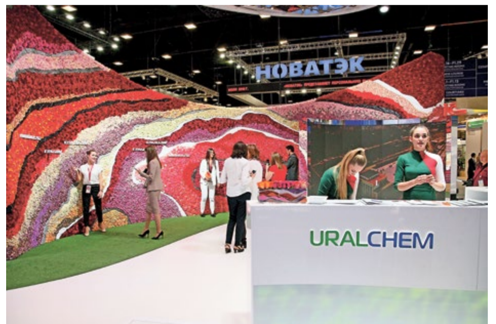
Женщины были без ума от стены цветов