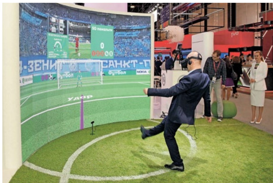
Желающих пробить виртуальный 11-метровый удар было немало

Российские высокотехнологичные компании тоже не давали публике заскучать. «Мегафон» отрабатывал тему приближающегося чемпионата мира по футболу. Гостям предлагалось пробить пенальти в очках виртуальной ре-