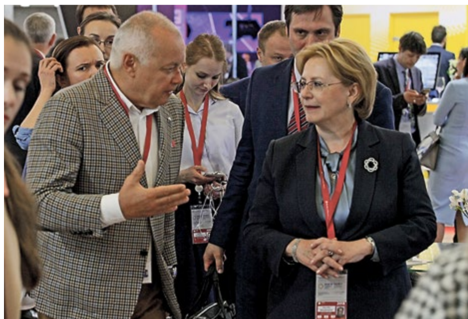
Телеведущий Дмитрий Киселёв беседует с главой минздрава РФ Вероникой Скворцовой